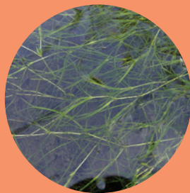
Zannichelle des marais