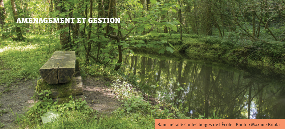
Banc installé sur les berges de l'École