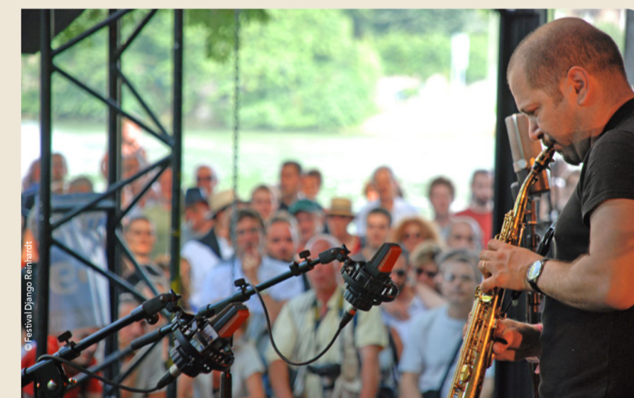
Festival de Jazz Django Reinhardt