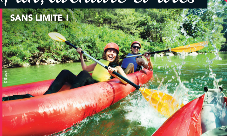
Du canoë sur la Marne

La Seine-et-Marne est un grand terrain de jeu ! Profitez de toutes les activités que vous aimez dans les îles et bases de loisirs. Adeptes du farniente, optez pour une plage de sable blanc à Jablines ou si vous êtes plutôt sportifs, choisissez les activités nautiques (catamaran, canoë, kayak, aviron...) à Vaires-Torcy.