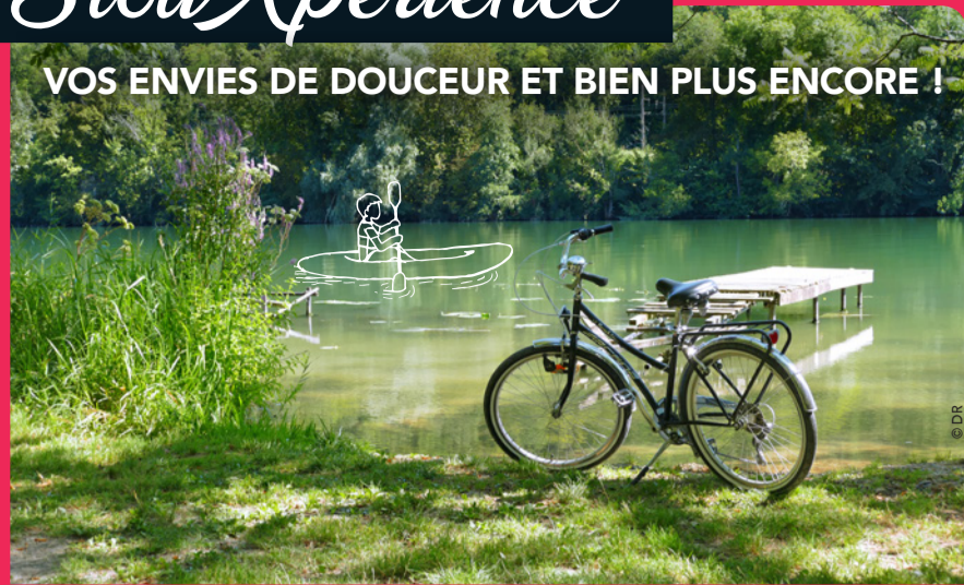
Au bord du Loing

VOS ENVIES DE DOUCEUR ET BIEN PLUS ENCORE !