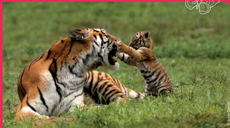
Le Parc des félins

N'attendez plus pour venir vivre de belles expériences en Seine-et-Marne et revenez vite car vous n'aurez certainement pas tout vu !