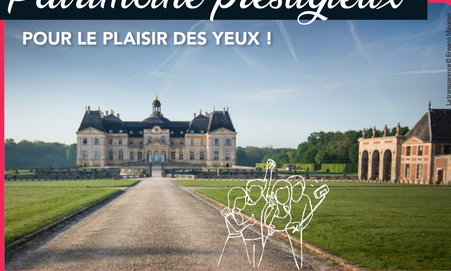
Château de Vaux-le-Vicomte

Traversez huit siècles d'histoire de France au château de Fontainebleau, cette vraie demeure des rois dotée d'un magnifique mobilier qui vous invite à une étonnante promenade à travers les siècles. À Provins, arpentez les rues et les ruelles de la cité médiévale où vous rencontrerez chevaliers et gentes dames, et serez attirés par la fragrance de la rose éponyme.