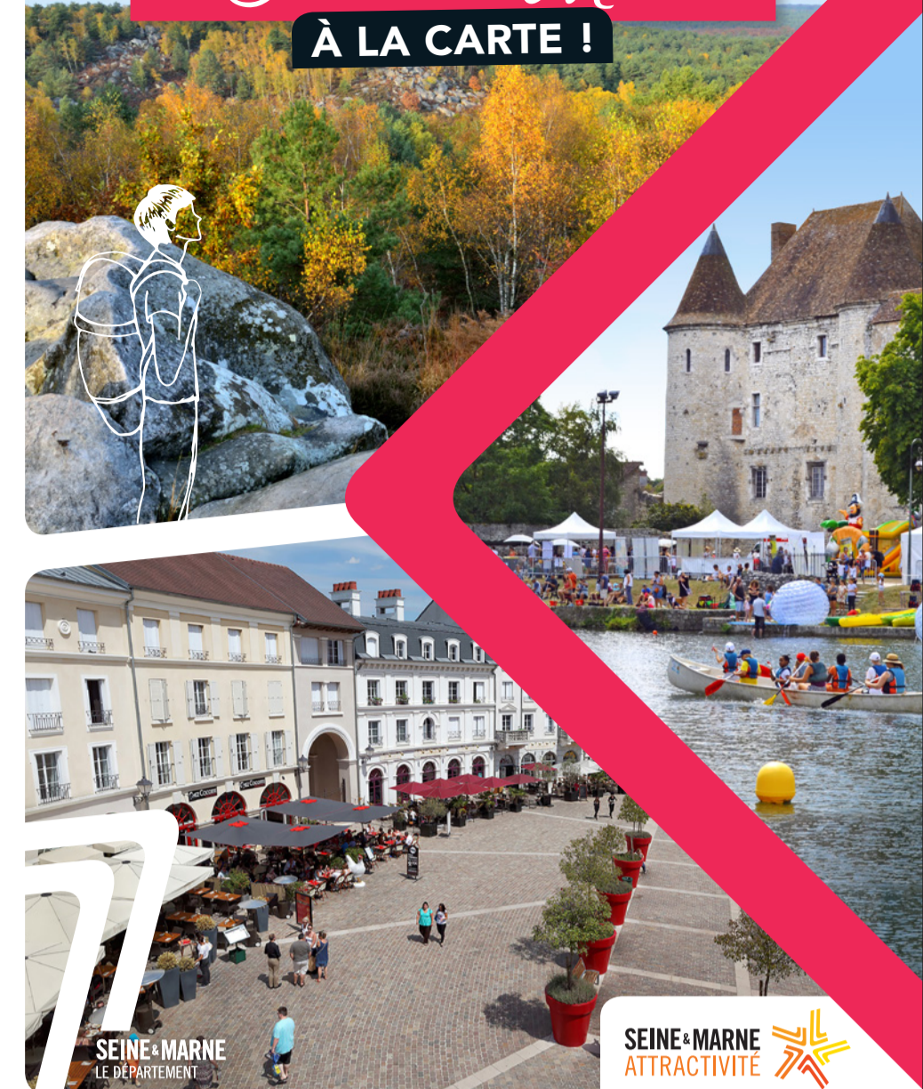
SEINE-MARNE LE DÉPARTEMENT