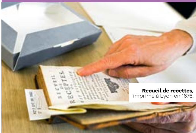
Recueil de recettes, imprimé à Lyon en 1676.

Ce petit livre est un recueil de recettes ayant appartenu à Madame Fouquet. À l'intérieur, des remèdes peu coûteux qui permettaient de guérir toutes sortes de maux : plantes médicinales, liqueurs, etc. Ce document témoigne de l'état de la médecine d'un temps. Et de remèdes parfois étonnants !