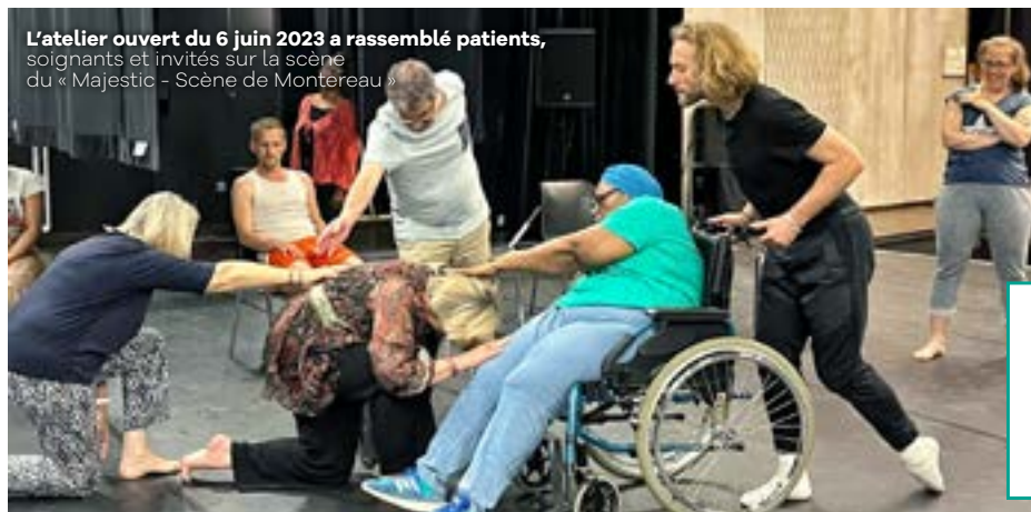
L'atelier ouvert du 6 juin 2023 a rassemblé patients, soignants et invités sur la scène du « Majestic - Scène de Montereau »

La pratique de la danse a également encouragé les échanges entre participants. En juin dernier, patients, soignants et invités ont participé ensemble à un atelier sur la scène du « Majestic ». Et tous ont été conviés dans ce même théâtre, le 24 novembre dernier, pour assister à une performance de Gerard et Kelly. Pour soutenir cette belle dynamique, une nouvelle résidence artistique sera mise en place au Majestic-Scène de Montereau en 2024, en lien avec l'hôpital, toujours avec cet objectif de favoriser l'épanouissement à travers la pratique artistique, d'améliorer la communication entre patients et soignants, de renforcer les liens entre les établissements médico-sociaux et les structures culturelles.