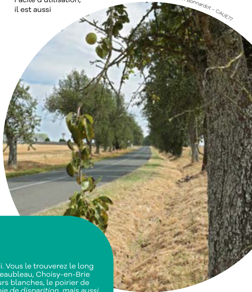
Alignement d'une centaine de poiriers de Carisi à Ozouer-le-Repos.