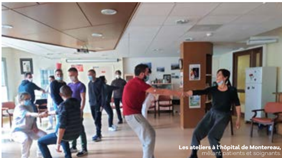
Les ateliers à l'hôpital de Montereau, mêlant patients et soignants.

Les activités proposées ont donné aux patients la possibilité de se surpasser, parfois même de réaliser des mouvements qu'ils n'envisageaient pas. « C'est une expérience