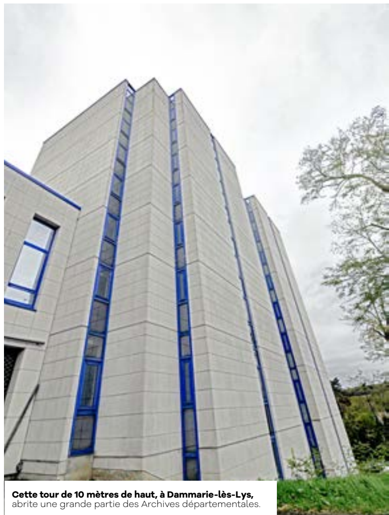
Cette tour de 10 mètres de haut, à Dammarie-lès-Lys, abrite une grande partie des Archives départementales.