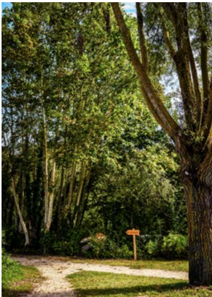
Le bois de la Bergette.